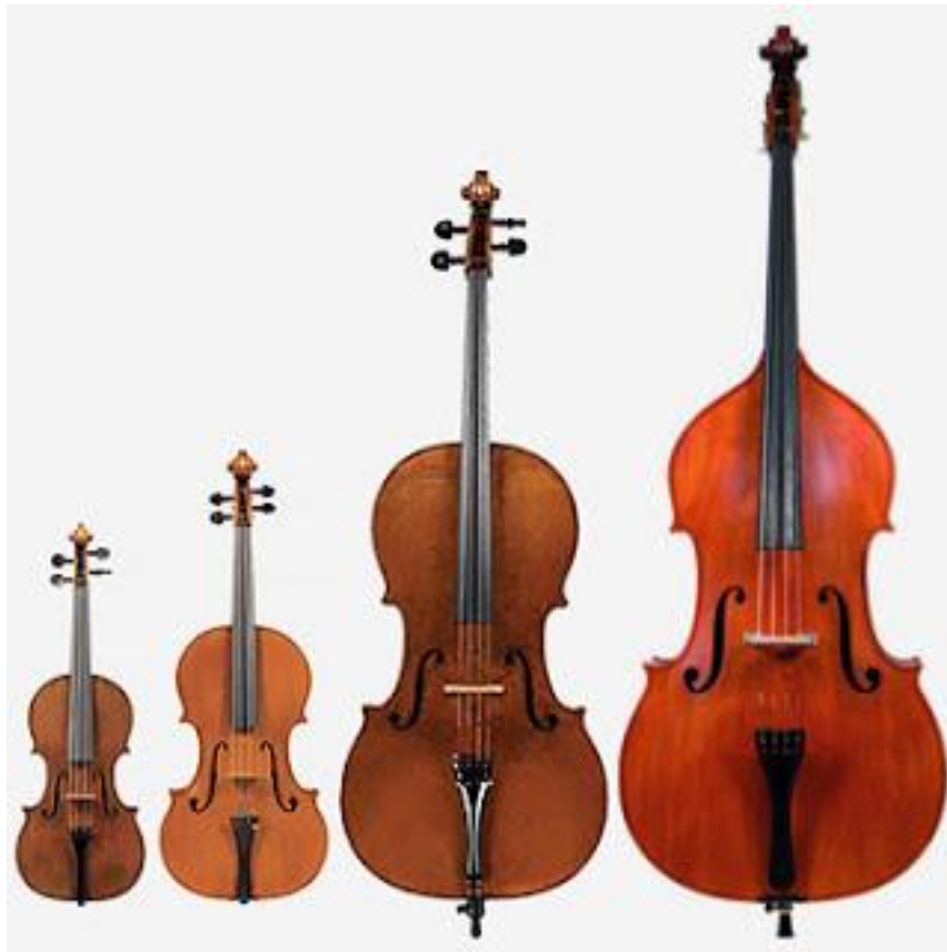
Βιολί – Βιόλα – Βιολοντσέλο – Κοντραμπάσσο